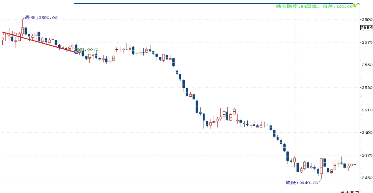
图表 2: 交易情况