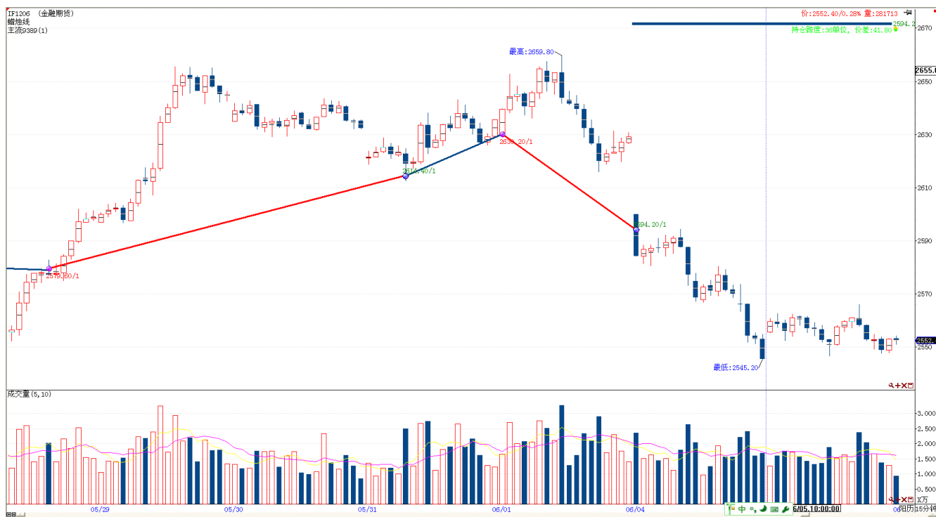
图表 2: 交易情况