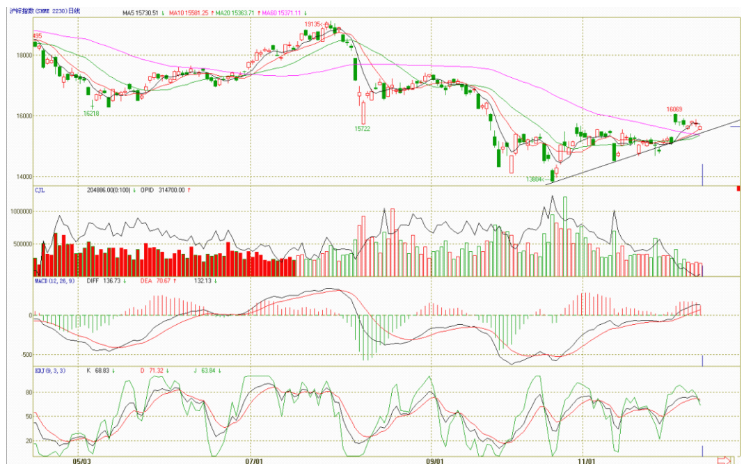
图1 沪锌指数日K线趋势分析

技术上如图1所示本周沪锌指数5个交易日各技术指标表现由强转弱。持仓量持续减缩，成交量也维持低位。MACD指标表现稍强，其中慢线继上周快线上穿零轴后也上穿零轴，两线持续上行。KDJ指标三线由上行转为回落，至周五形成高位“死叉”。