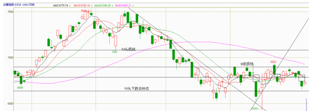
图2 郑糖指数回归大震荡区间中轴

回补缺口，反抽过程均持续5个交易日以上，本周五出现的抵抗性小阳线较前两次跳空下跌次日有相似之处。