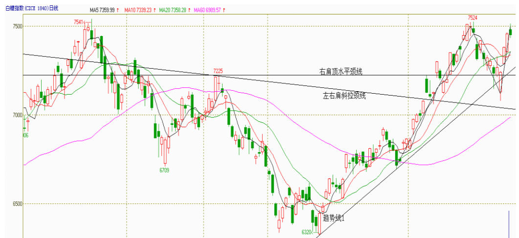
图1 郑糖指数日K线趋势分析