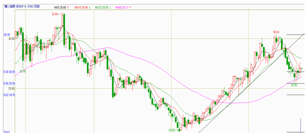
图2 ICE11号原糖指数日K线分析

本周伴有跳空缺口的长阳线迅速收复7月28日来的跌幅，量能配合积极，在周五冲击前高后虽报收小阴线，但至收盘，多头主力领军会员增仓共振，与常规见大顶部形态的资金出入节奏不符，应解读为关键压力位置的整固消化较为合理，是持续形态而非反转形态。