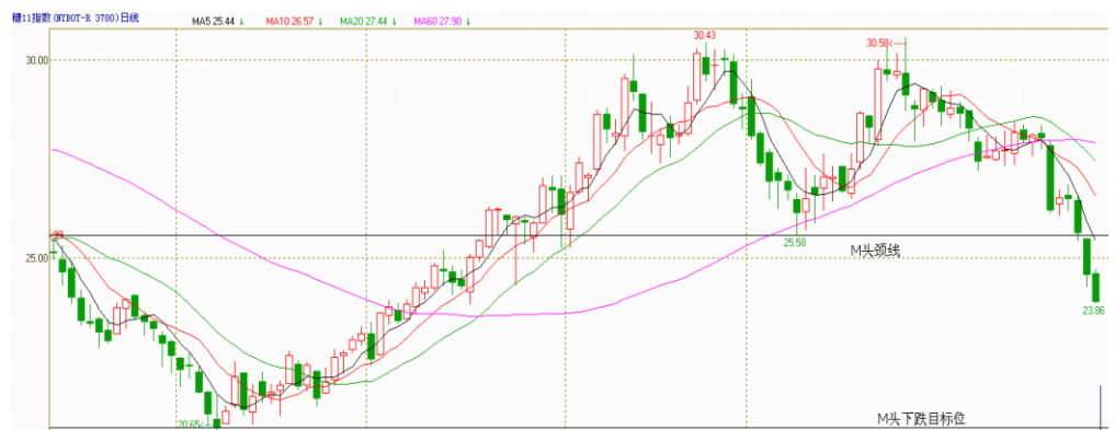
图2 ICE11号原糖指数日K线分析

据技术分析经验总结，M头下跌目标位到达之后，出现反弹修复的概率大于继续加速下跌的概率，因此，我们有必要对可能发生的反弹作出防范，不过，在没有出现企稳反弹信号之前不宜过早臆测反弹而抢进多单。