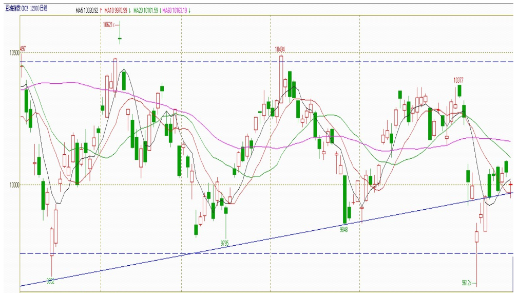
图一：豆油指数日走势图（2011年3月至今）

图二，豆油周K线图显示，长周期来看，豆油震荡市持续时间超过半年，价格新低后收出周十字星，年内两个重要的低点，正是斐波纳齐第21个交易周期的位置，技术而言止跌反攻具备多重共振。