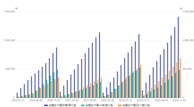
图 4. 主要地区工业硅产量（吨）