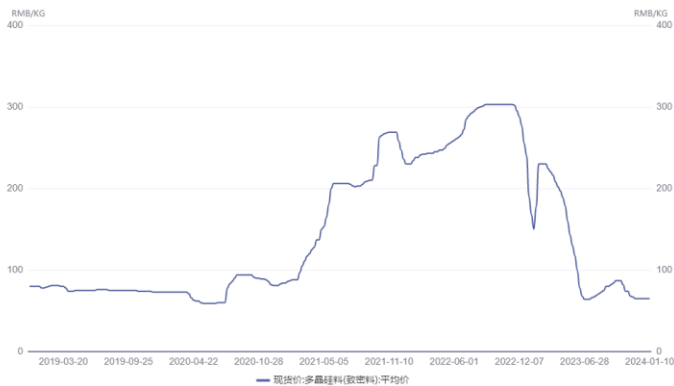
图 7. 多晶硅致密料价格（元/吨）