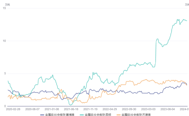
图 10. 三大港口库存（万吨）