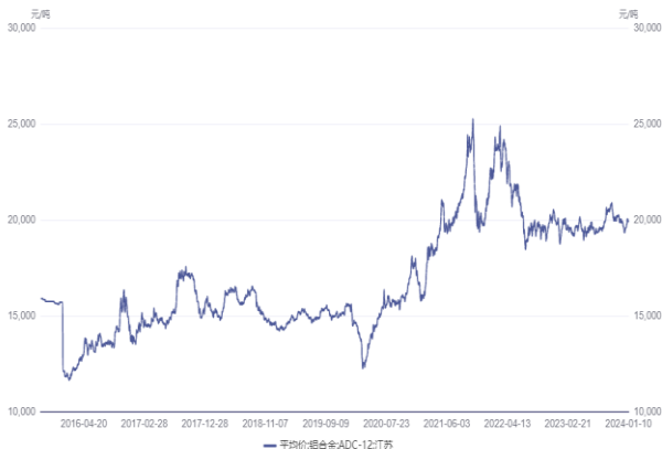
图 8. 铝合金 ADC12 价格（元/吨）