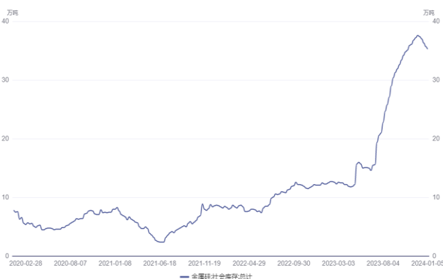
图 9. 工业硅总库存（万吨）