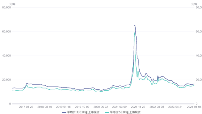
图 1. 华东通氧 553#、工业硅 3300#价格走势（元/吨）