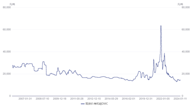
图 6. 有机硅 DMC 价格（元/吨）