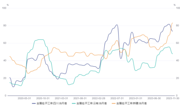
图 5. 主要地区开工率（%）

据百川盈孚统计，目前金属硅总炉数 750 台，本周金属硅开炉数量与上周相比增加 3 台，截至 1 月 11 日，中国金属硅开工炉数 301 台，整体开炉率 40.1%。 西北地区： 西北地区金属硅开工平稳，其中新疆地区开炉数 123 台，陕西开炉数 8 台，青海开炉数 3 台，甘肃开炉 14 台。 西南地区： 西南地区金属硅开工平稳，云南开炉 46 台，四川地区开 21 台，重庆地区开炉 12 台，贵州地区开炉 5 台。 其它地区： 福建地区开工 7 台，而东北地区金属硅开工 13 台，内蒙古地区目前开炉 28 台，广西地区开工 5 台，湖南开炉 3。